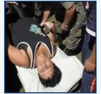
El drama del dengue en Brasil, en fotos