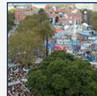
Dos actos masivos de una Argentina dividida