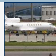
Chávez se propone para ir con Sarkozy por Betancourt