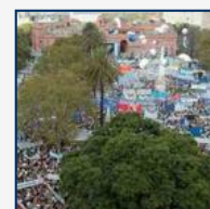
El color del acto de Cristina en la Plaza de Mayo