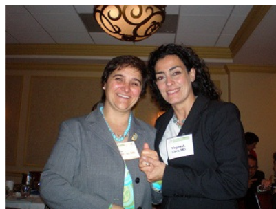
Foto: En la foto la Dra. Virginia Llera, presidenta electa de ICORD y su antecesora la Dra. Domenica Taruscio Directora del Centro Nacional de Enfermedades Raras, del Instituto de Seguridad Social de la República Italiana.

La historia comienza en el año 1983, al gestarse el concepto de Enfermedad Rara, mediante la aprobación del Acta de Drogas Huérfanas en los EE.UU. Con ello toda una nueva idea en salud pública se incorporaba a la agenda política. Pasaron luego 20 años para que se considerara esta temática en Europa. En efecto, en el año 2000 la Unión Europea aprueba una ley similar a la de EE.UU. integrando esfuerzos para el colectivo de ciudadanos que padecen estas patologías.